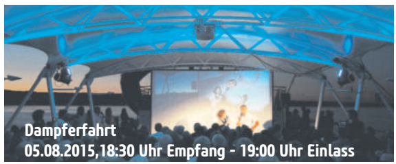
Dampferfahrt 05.08.2015, 18:30 Uhr Empfang - 19:00 Uhr Einlass