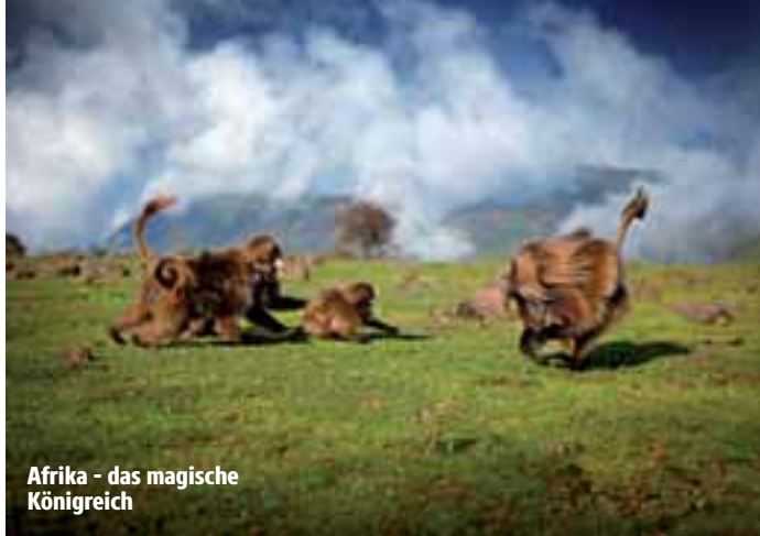
Afrika - das magische Königreich

Termine: Ab 26.3.2015 in den Breitwand-Kinos