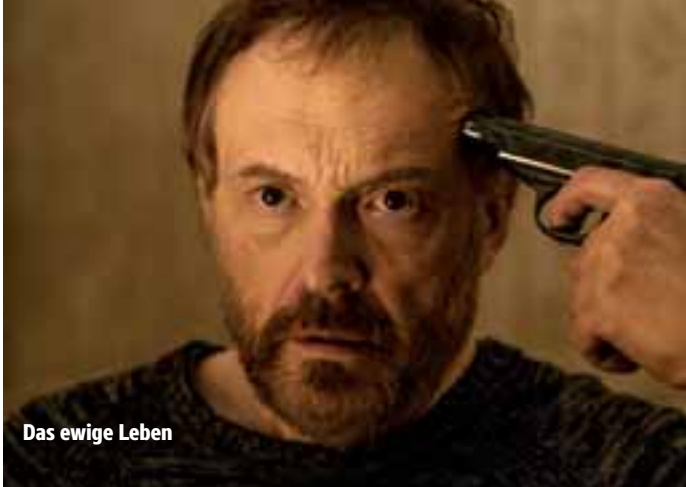
Das ewige Leben

Termine Weiter ab 26.03.2015 in den Breitwand-Kinos