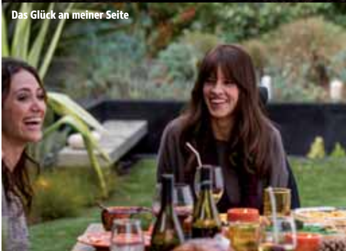
Das Glück an meiner Seite