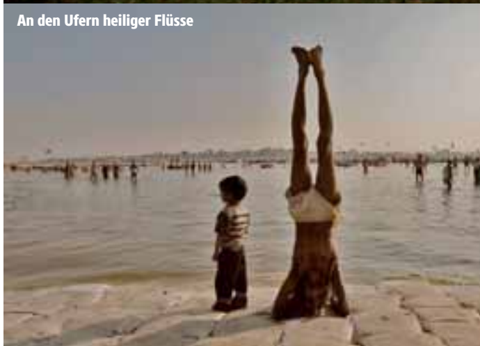
An den Ufern heiliger Flüsse