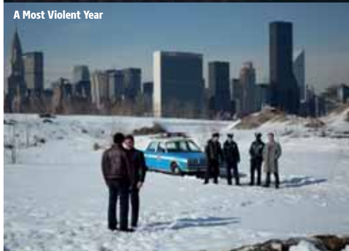
A Most Violent Year