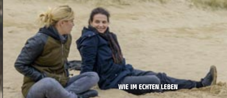
WIE IM ECHTEN LEBEN