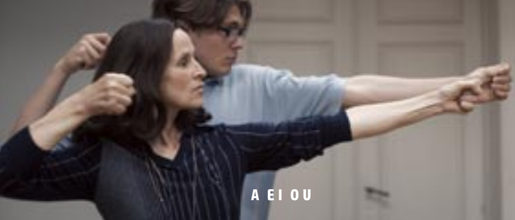
A E I O U