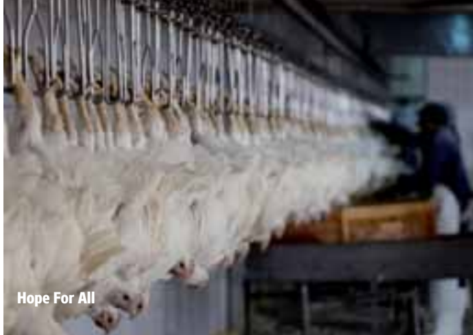
Hope For All