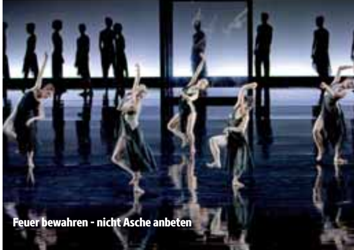
Feuer bewahren - nicht Asche anbeten