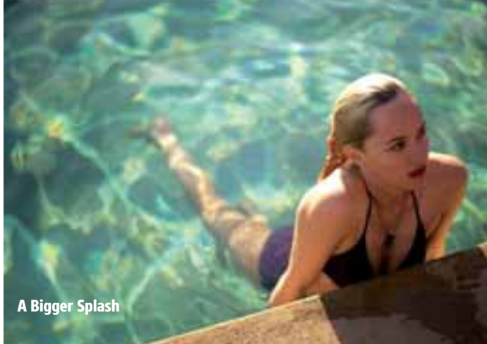
A Bigger Splash