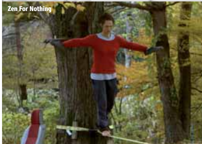
Zen For Nothing