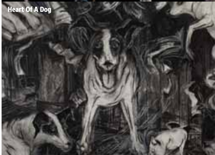
Heart Of A Dog