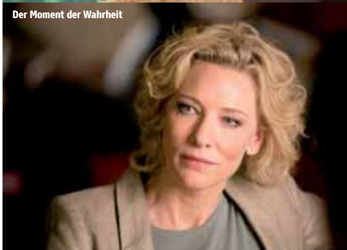
Der Moment der Wahrheit