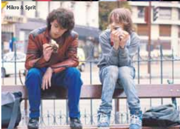
Mikro & Sprit