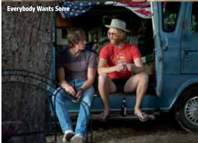
Everybody Wants Some