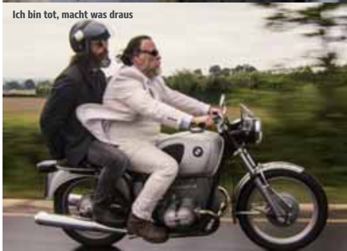
Ich bin tot, macht was draus