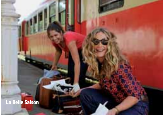
La Belle Saison