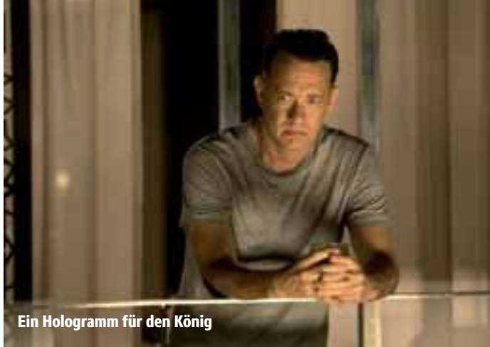
Ein Hologramm für den König