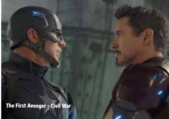
The First Avenger - Civil War