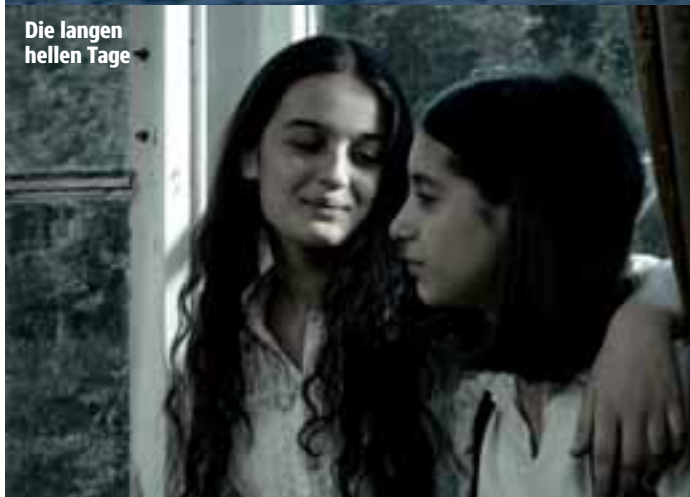
Die langen hellen Tage