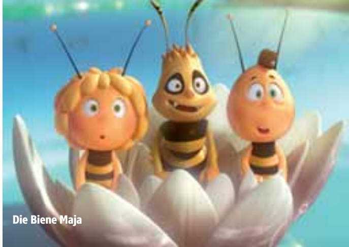
Die Biene Maja