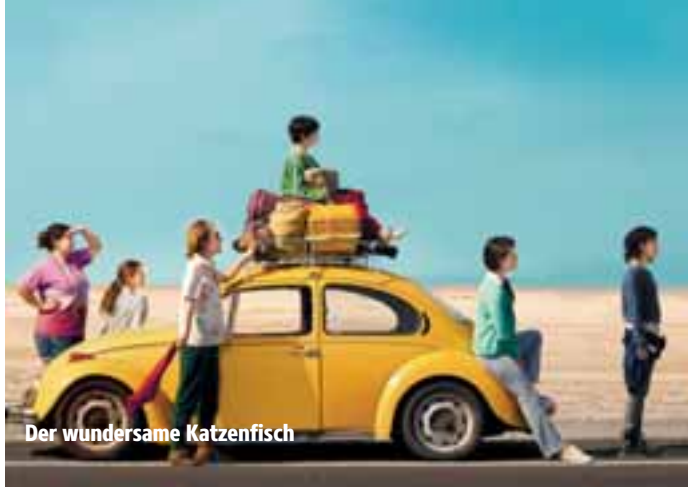
Der wundersame Katzenfisch

Termine: 13.08. 20:00 Uhr Starnberg 20.08. 18:30 Uhr Seefeld 27.08. 20:30 Uhr Herrsching