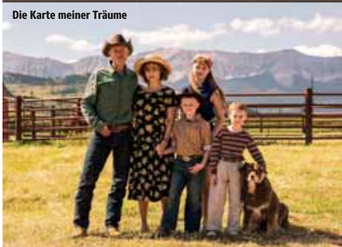
Die Karte meiner Träume