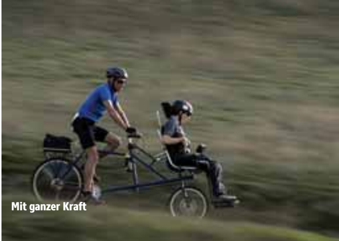
Mit ganzer Kraft