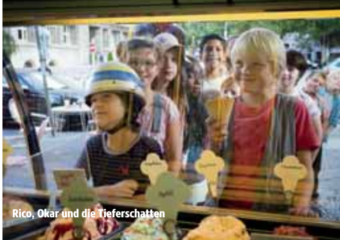
Rico, Oskar und die Tieferschatten

Termine Ab 04.08. Starnberg Ab 07.08. Herrsching Ab 14.08. Schloss seefeld