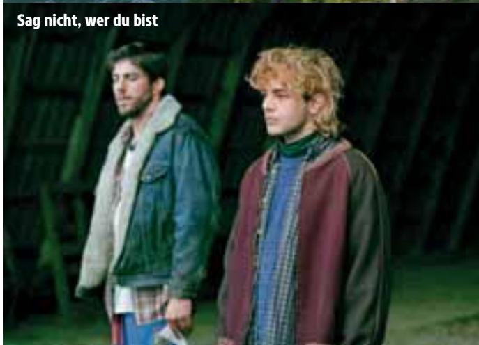
Sag nicht, wer du bist