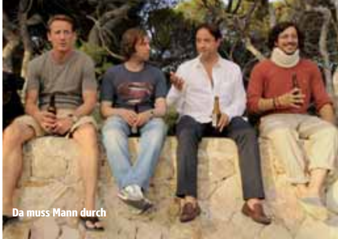
Da muss Mann durch