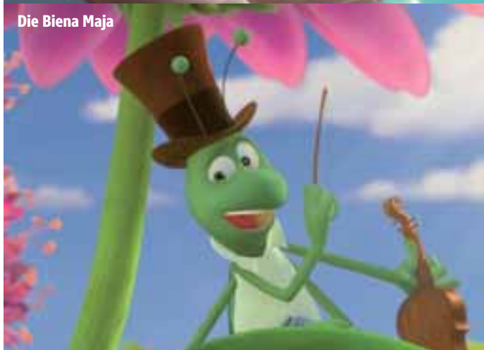
Die Biene Maja