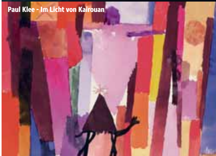
Paul Klee - Im Licht von Kairouan