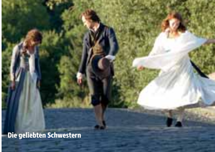
Die geliebten Schwestern