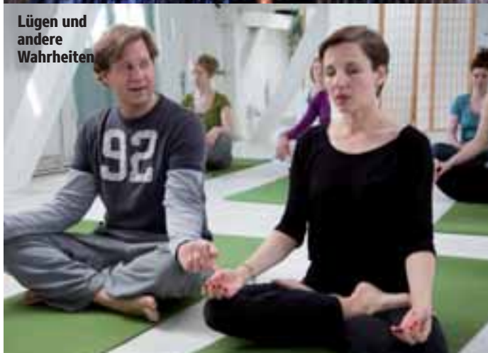
Lügen und andere Wahrheiten