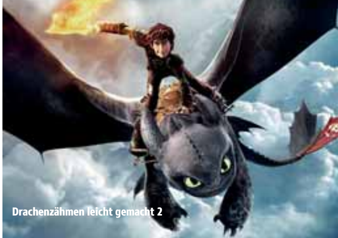
Drachenzähmen leicht gemacht 2

Termine: Ab 04.08. Starnberg Ab 28.08. Schloss Seefeld Ab 04.09. Herrsching