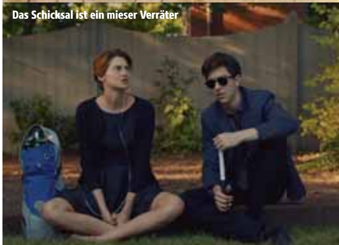
Das Schicksal ist ein mieser Verräter