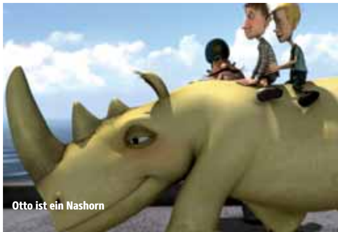
Otto ist ein Nashorn

Termine: Ab 14.08. Seefeld Ab 21.08. Starnberg Ab 28.08. Herrsching