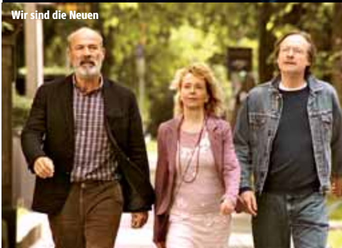
Wir sind die Neuen