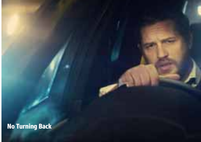
No Turning Back